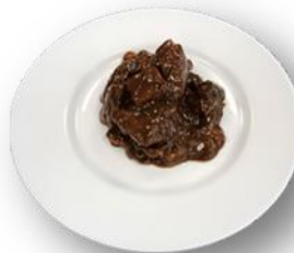
Art. 430502 Hirschgulasch in Honig – Lebkuchensauce 2,8 kg