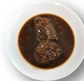
Art. 246002 Ochsenbäckchen in Sauce 2,8 kg