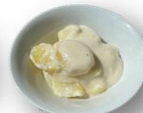
Art. 651702 Kartoffelgratin 2,7 kg