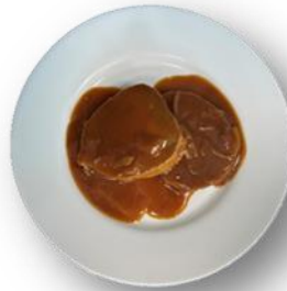
Art. 210902 Rinderbraten in Apfel- Zwiebelsauce 2,8 kg