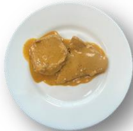
Art. 140041 Schweinerückenbraten in Calvadosauce 2,8 kg