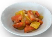
Art. 602301 Karotten Rustica 2,0 kg