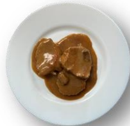
Art. 230992 Kalbsmedaillons in Morchelrahm- sauce 2,8 kg