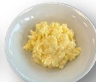
Art. 653002 Kartoffelstampf 2,5 kg