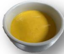
Art. 551801 Kürbis-Orangen- Suppe 2,8 kg