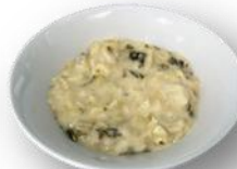
Art. 606102 Wirsinggemüse in Rahm 2,8 kg