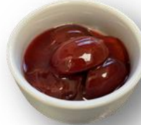
Art. 870701 Zimtpflaumen 2,7 kg