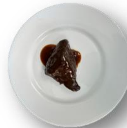
Art. 430011 Hirschmedaillons in Rotwein- Lebkuchensauce 2,8 kg