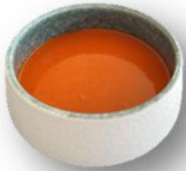
Art. 554802 Paprikarahmsuppe mit Rauch 2,8 kg